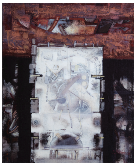
Amurg pe valea Draghiștei , 2001, u. p., 85 × 70 cm.