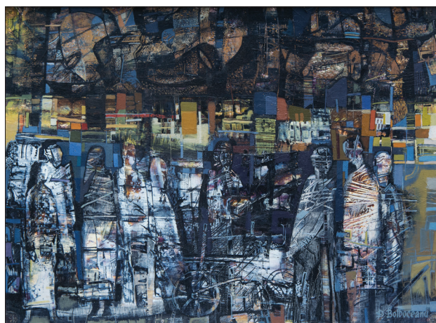
Chemarea ploii , 1997, u. p., 30 × 40 cm.

Așa, în tabloul Amintiri , imaginea, prin modul de structurare compozițională a motivelor, prin maniera de tratare iconografică a formei, prin alternanțele cromatice și simbolismul culorilor, incită la contemplarea unui limbaj extrem de personalizat, la o aprofundare meditativă în arealul semantic complex al operei. Or,