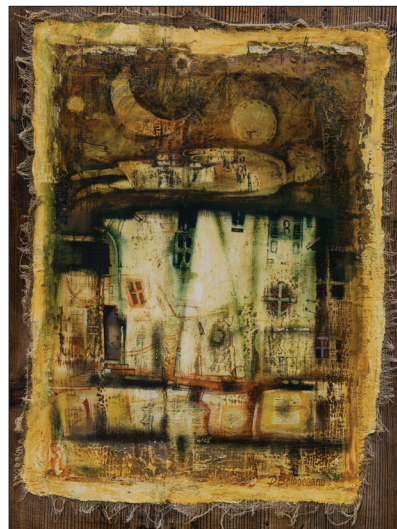
Din ciclul Transcendență III , 2001, teh. mix., 50 × 38 cm.

De menționat că în naturile statice realizate atât la hotarul anilor '80-'90, cât și mai târziu, plasticianul caută să soluționeze probleme sintactice originale ce țin de amplificarea expresivității mijloacelor artistice, a valorii estetice și a mesajului generat de contrastele tonale ale culorilor de alb și negru, acestea fiind tratate valoric vast și elegant ( Natură statică , 1989). Or, el continue să valorifice expresiile preponderent în suprafața planului, să-și realizeze compoziția în conformitate