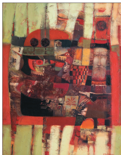
Pe valea Draghiștei , 2017, u. p., 120 × 95 cm.

preponderent constructivistă spre racordarea și suplînirea acesteia cu o gamă coloristică care, concomitent cu modul de tratare constructivist-austeră a formei și expresiile statuare în structura compozițională denotă o evoluție substanțială a demersului plastic. Reorientarea sa spre alte principii de orchestrare a imaginii s-a produs cu începere din anul 1995 și a evoluat treptat până la sfârșitul deceniului, soldându-se cu un șir de creații remarcabile, printre care Lacul (1995) (la începutul deceniului următor, lucrarea dată va impulsiiona inițierea unui ciclu sub denumirea sugestivă Transcendență ), Amintiri (1996), Chemarea ploii (1997), o altă lucrare cu aceeași denumire Lacul (2000) și o primă valorificare a unei teme fundamentale, de inspirație biblică, prin tabloul Arca lui Noe (1999), temă ce și-a găsit o dezvoltare organică într-un șir de creații cu aceeași denumire de-a lungul ultimelor două decenii.