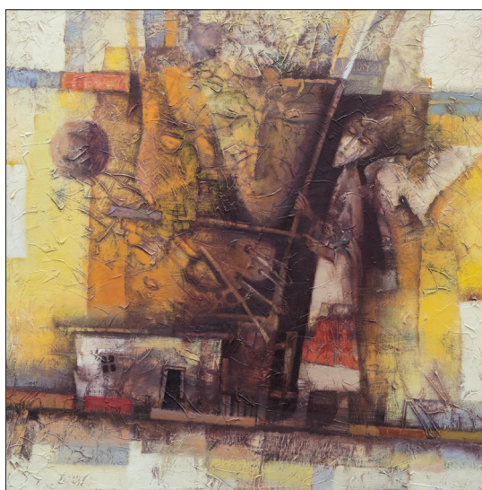
Trecerea , 2017, u. p., 60 × 60 cm.