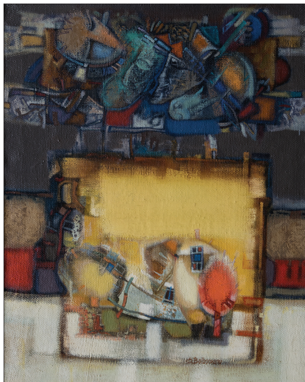
Amintiri , 1996, u. p., 100 × 80 cm.

Creația ultimului deceniu al secolului al XX-lea se încununează cu un șir de lucrări în care artistul își definitivează principiile și particularitățile de constituire morfologică a formei, modalitățile de orchestrare sintactică a imaginii, consolidându-și totodată fațeta stilistică. Reprezentative pentru această perioadă de avânt experimental sunt tablourile Natură statică (1993), Natură statică (1998), Moara veche (1995), Noapte cu lună (1999). Fiind realizate la distanță de câțiva ani una de alta, lucrările respective oglindesc plenar evoluția preferințelor iconografice ale artistului, or, modalitățile de abordare a motivelor, a planului, a spațiului tabloului, evoluează spre complexitate structurală. Așa, dacă în Natură statică realizată în anul 1993, expresia estetică și, în paralel, conotațiile imaginii, sunt generate de modul de amplasare rați-