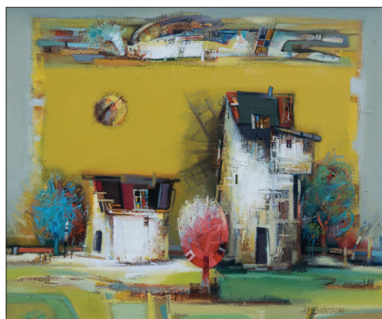
Moara veche , 2001, u. p., 45 × 55 cm.