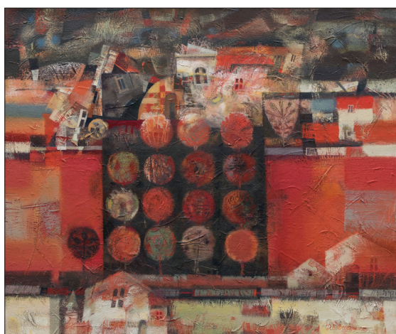
Livada , 2017, u. p., 80 × 95 cm.

Diferențele de abordare sunt cât se poate de concludente la examinarea a două lucrări omonime, Moara veche – una creată la mijlocul anilor '90 și alta la sfârșitul acestora. La această temă, de altfel, pictorul revine periodic pe parcursul activității sale. Dacă în prima lucrare artistul selectează riguros forme sugestive din peisajul autohton, apelând la stilizare, apoi în cea de-a doua se face observată o deviere de la estetica