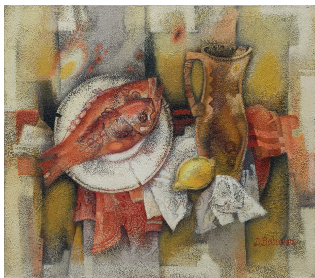
Natură statică , 2010, u. p., 64 × 73 cm.

La aceasta contribuie și maniera de a opera cu asemenea elemente grafice ca linia, pata și textura, conferind imaginii un plus de dinamism și relevanță. Contrastul cromatic pune și el în valoare fenomene dispersate atât temporal, cât și spațial, or, proprietățile energetice ale nuanțelor calde reliefează planul realității actuale, iar culorile reci, prin intermediul cărora se evocă ideea memoriei, oglindesc iconografic sec-