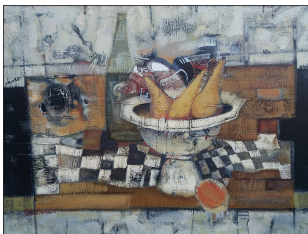
Natură statică , 2006, u. p., 85 × 95 cm.