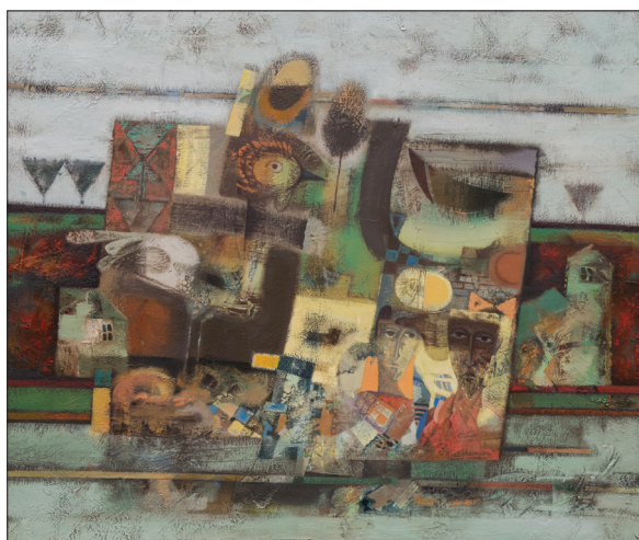
Primăvara , 2020, u. p., 100 × 120 cm.

natului dintr-un studiu anterior: „În opera artistului sensibilitatea, cunoașterea, germinația estetică a formelor generează noutatea suprafețelor. În construcția formală, dar și cognitivă, artistul își îndreaptă atenția în mod special spre o gramatică a limbajului plastic, spre rațiunea structuralistă, spre manierismul stilistic și jocul cu semnul și semnificația acestuia. Imaginea terestrului și a cosmicului, elementele mitice și fantastice în aceeași măsură iau parte la construirea unei lumi picturale pornind de la realitate, dar nu neapărat corespunzătoare realității. Un rol important în concepția metaforelor plastice din creația lui Dumitru Bolboceanu le revine unor valori ale civilizației universale înregistrate pe parcursul evoluției ei milenare. Literatura laică și cea creștină, etica, morala, tradiția și modernitatea sunt adunate într-un tot întreg, menite să reflecte complexitatea meditațiilor, adesea nostalgice, ale contemporanului față în față cu realitatea și istoria. Visul reprezentând subconștientul, reconstituie imagini ce poartă conotații difuze, punând în prim plan valorile imaginare ținând de memorie, pentru a obține forme distinctive ale impulsurilor subconștiente.” [2, pp. 187, 188].